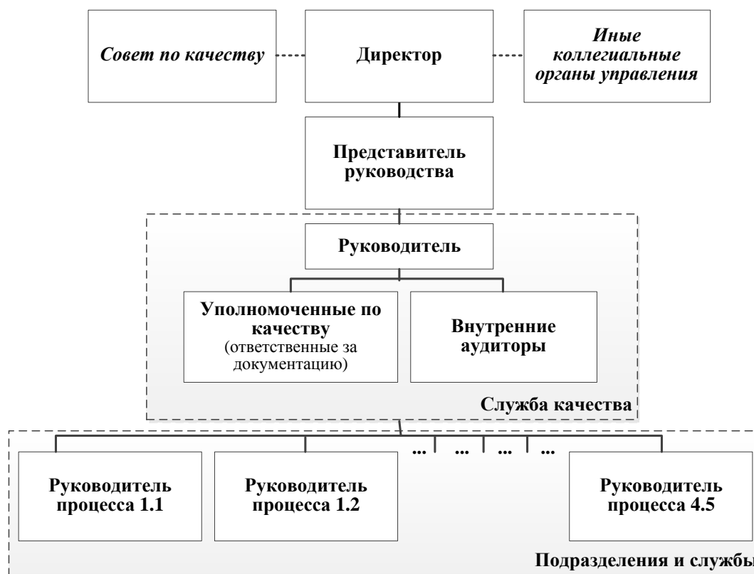
Рисунок 2 – Функциональная схема системы менеджмента качества